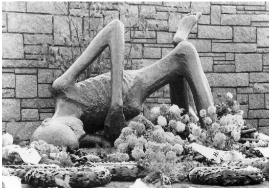
KZ Neuengamme (Internationales Mahnmal)