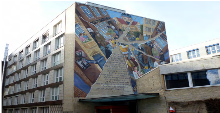
Wandbild »Jüdische Kultur am Grindel«