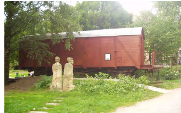
Güterwagen an der Gesamtschule Winterhude