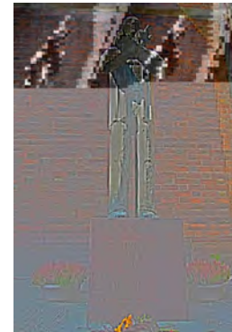
Denkmal für Dietrich Bonhoeffer